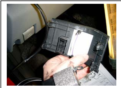
Kontroll-LED in die Abdeckung mit 8 mm-Bohrer montieren