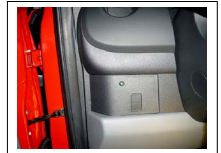
Ansicht der Kontroll-LED

Alle ausgebauten Verkleidungsteile im Kofferraum wieder montieren.