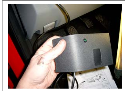
Vor dem Schließen der Klappe die nun lose liegenden Relais mit dem beiliegenden Filz umkleben (gegen Klappern)