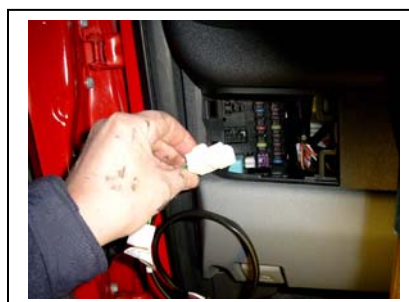
An dessen Stelle den passenden Stecker des Kabelbaumes aufstecken