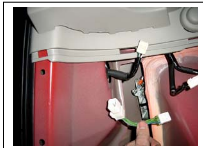
Auf der linken Seite genauso verfahren