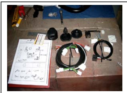
Einzelteile sortiert bereitlegen