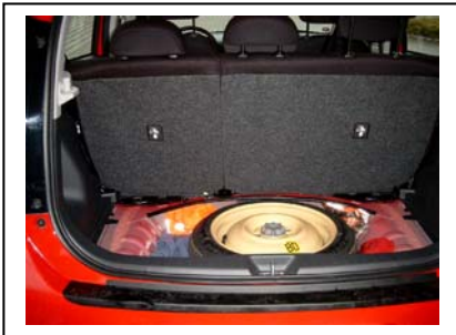
Kofferraumabdeckung und Inhalt entfernen