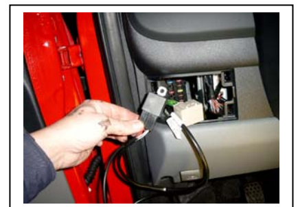
Neues Blinkrelais auf die andere Seite des Kabelbaumes aufstecken