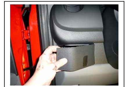
Unten links neben dem Lenkrad die Abdeckung des Sicherungskastens öffnen