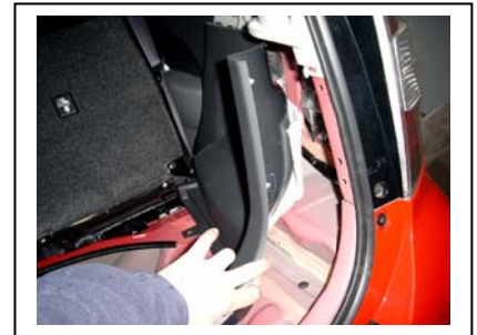
Seitenverkleidung auf beiden Seiten entfernen