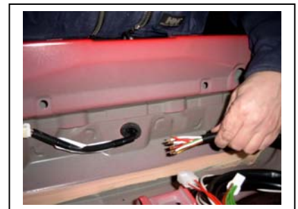
Kabelbaum durch Hecktülle führen