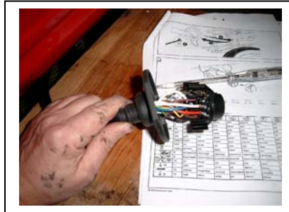
Gummitülle aufschieben und Steckdose nach Belegungsplan anschließen