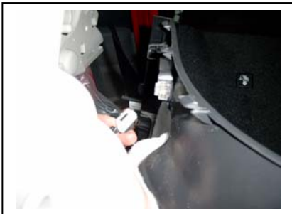
Bei der linken Seitenverkleidung die Steckverbindung der Kofferraumbeleuchtung lösen