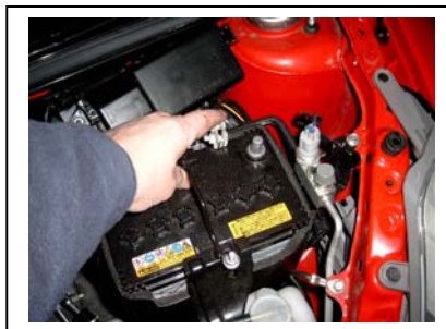
Massekabel an Batterie lösen