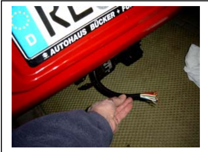
Kabelbaum ein Stück herausziehen (zur leichteren Montage)