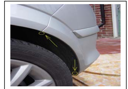
2 Schrauben Links rausdrehen