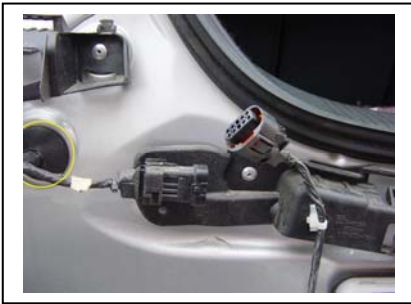
Durchführung für Rückfahr-Sensoren belegt