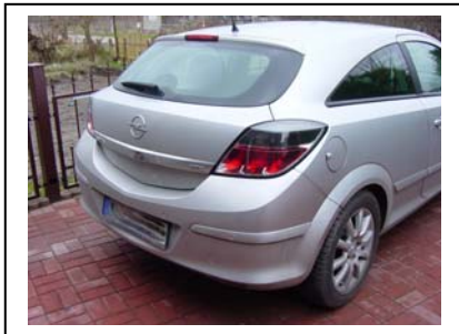
Fahrzeug von hinten