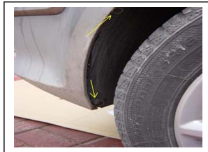
2 Schrauben Rechts rausdrehen