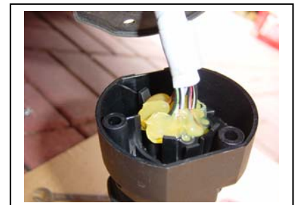
Steckkontakte mit Polfett bestreichen – gegen Korrosion