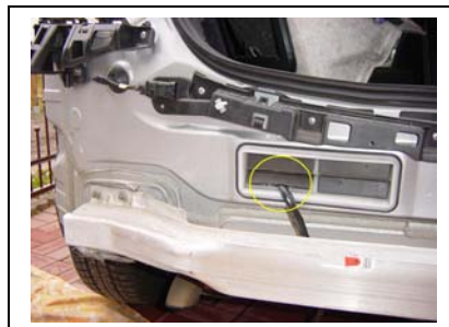
Stoßfänger abgenommen Kabel durchgeführt