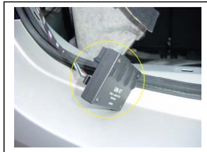
das ende der Leitung in die Steuereinheit stecken