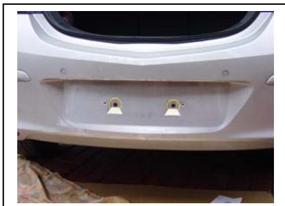
2 Schrauben Mitte rausdrehen