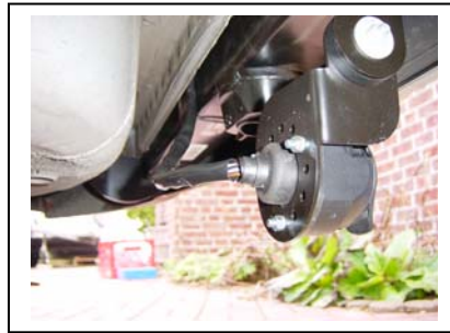
Steckdose von hinten