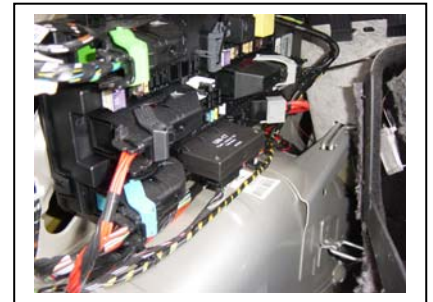
Steuereinheit in den vorgesehenen Steckplatz einstecken